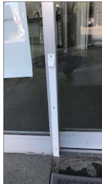
貼り付け終了後の吸着板