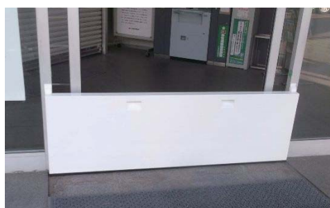
止水パネルの取り付け終了