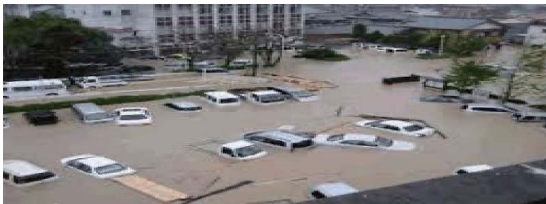
■集中豪雨や河川の氾濫による洪水イメージ

地球温暖化によると言われている気象変動によりゲリラ豪雨が多発し浸水被害が増加しています。何時・どこで発生するかわからない中で、緊急対応が必須です。一人で・何時でも・対応できる止水板が最も求められています。「ピタッとパネル」は最も適した止水板です。