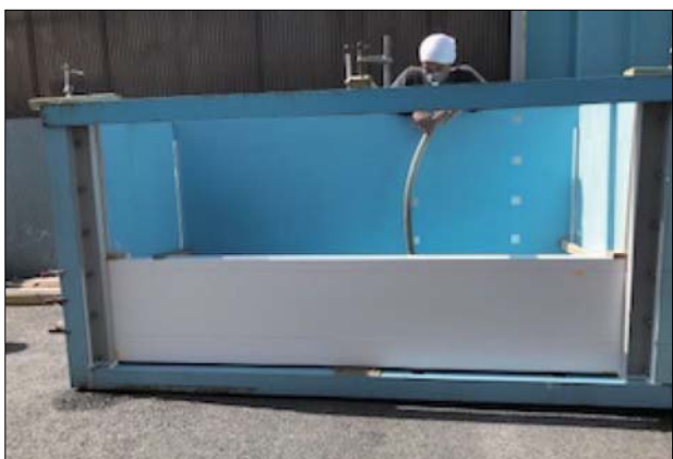
②水槽にパネルをセット