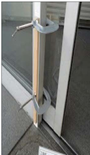
吸着板をドア枠に接着剤で貼り付け万力で固定する