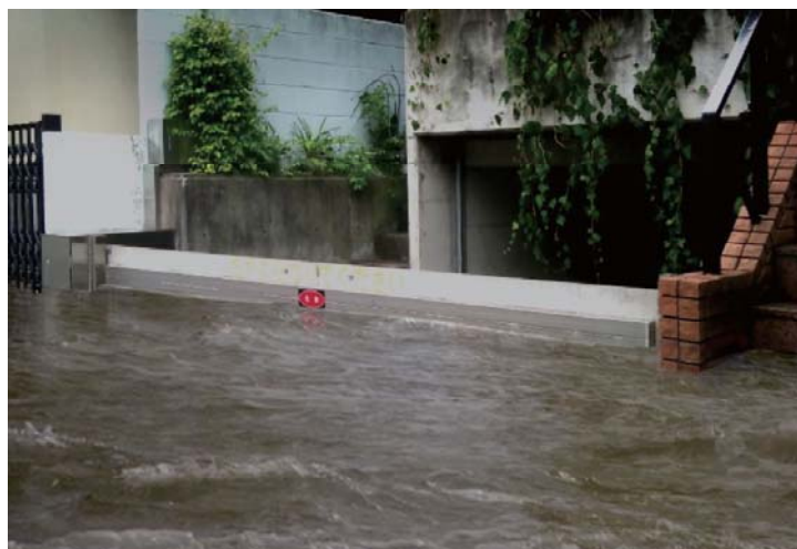
■地下駐車場への浸水を防ぐ止水板事例

地球温暖化によると言われている気象変動によりゲリラ豪雨が多発し浸水被害が増加しています。何時・どこで発生するかわからない中で、緊急対応が必須です。一人で・何時でも・対応できる止水板が最も求められています。「ピタッとパネル」は最も適した止水板です。