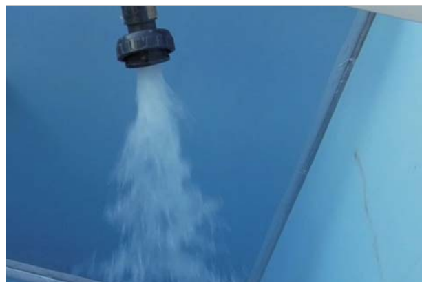
③水槽に水を注入開始